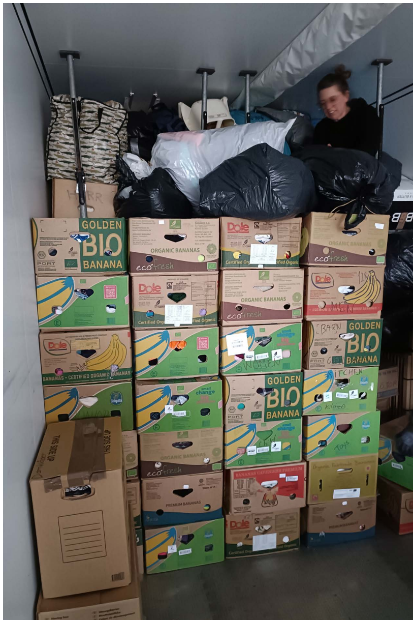
Lastning i Solberga den 1 februari.