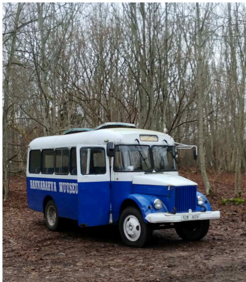
Museibussen på Nargö