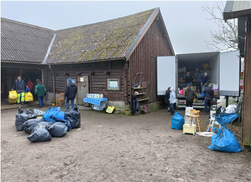
Lastning i Solberga den 1 februari.